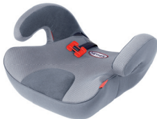
SafeUp L ERGO