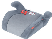
SafeUp M ERGO