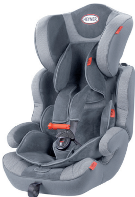
MultiProtect ERGO SP