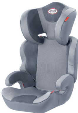
MaxiProtect ERGO SP